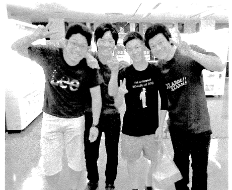
第3位 (株)萩原鐵工所