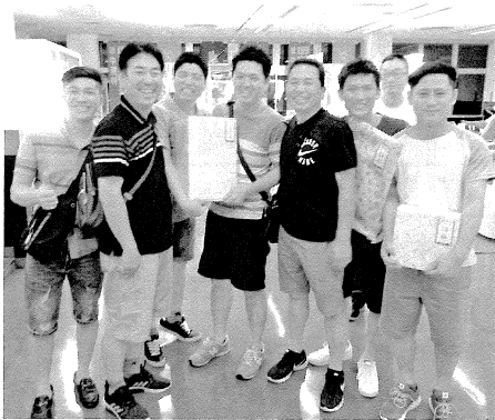
準優勝 (株)山口製作所