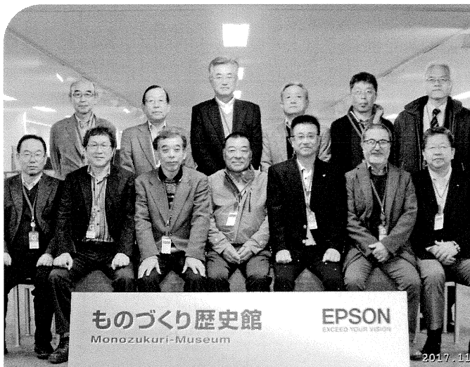
●セイコーエプソン株式会社●

11月12日、13日の二日間、長野県に研修視察に行ってきました。12日には、長野県小諸にあるマンズワイン小諸ワイナリーを見学、オリエンテーションルーム（PR室）にて小諸ワイナリーの概要・ぶどうの話・ワイン造りの製造工程等の説明を受け、工場内を見学。13日には諏訪湖に面した自然豊かな広大な敷地のうえに、「省・小・精の価値」で、人やモノと情報がつながる新しい時代を創造するセイコーエプソン株式会社本社を訪問。プリンターをはじめ腕時計、さらには環境保全にも考慮したPaperLabによる紙のリサイクルへの挑戦、「自律型双腕ロボット」による2本の腕の製造現場の自動化等を拝見させていただき、ただただ感動するのみでした。また、「ものづくり塾」による、「技能道場」としての「時計」の超微細・精密加工技術をコアとして成長・発展してきたセイコーエプソンのものづくりのスキルアップの取組みには、多々学ぶところがありました。