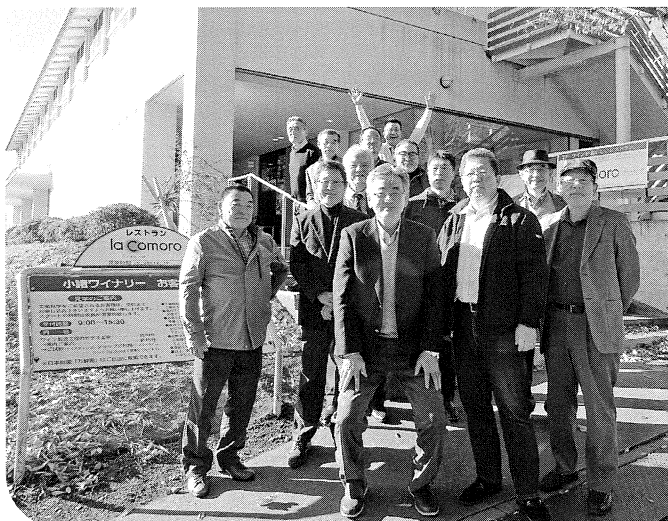
●マンズワイン小諸ワイナリー●