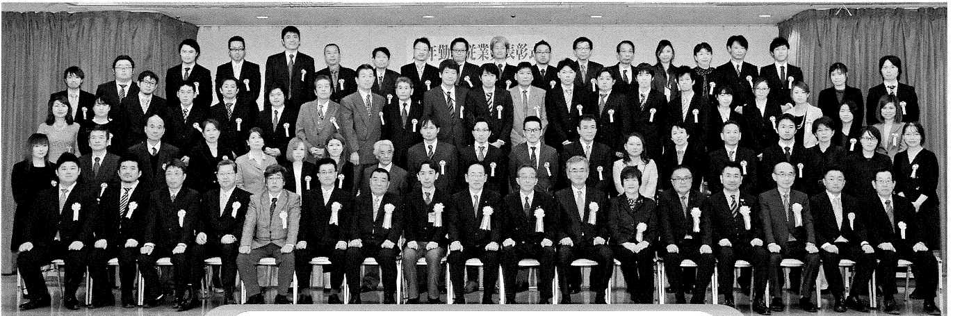
受賞者の皆様 おめでとうございます。

11月22日、平成29年度の永年勤続表彰式を、福田屋百貨店コンベンションホールにて開催しました。今年度の受賞者は、勤続年数40年が3名、35年が1名、30年が5名、20年が11名、10年が45名、合計65名でした。鹿沼市長をはじめ、来賓の方々には、長きにわたり組合企業を支えてきた社員の皆様へ、激励のお言葉を頂きました。