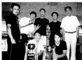
(株)野中スチールチーム