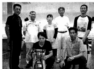
個人優勝～5位入賞の皆さん