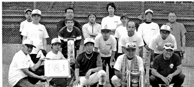
準優勝 (株)萩原鐵工所 Aチーム