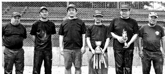
第3位 テクノメイトチーム

◎野球場にアディダスのトレーニングウェア(上着)の忘れ物がありました。お心当たりのある方はカナマックスまでご連絡ください。