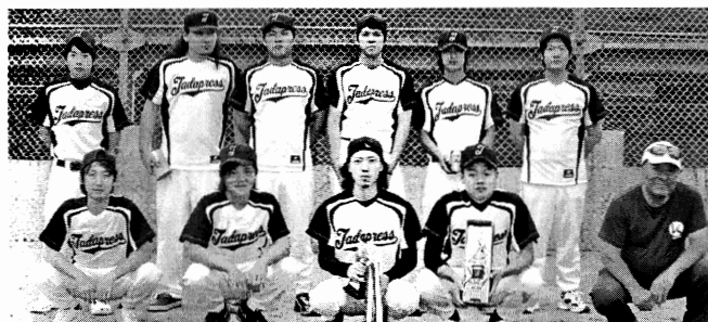
第3位 多田プレス工業(株)チーム