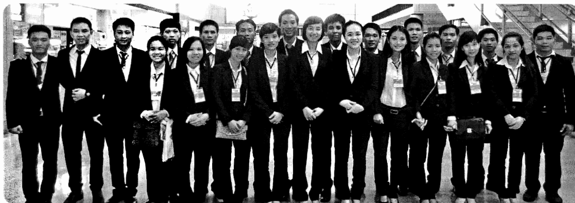
成田空港に入国したばかりの実習生です。

9月12日(金)に23名(株)ナカニシ17名 (株)TANOI 3名 青和現代彫刻(株)1名 (株)スズキプレシオン1名 (株)エヌ・エステクニカル1名)の実習生が、希望に胸を弾ませて鹿沼に来ました。