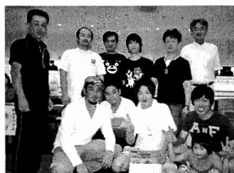
(株)橋本製作所チーム