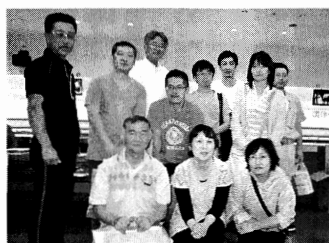
(株)マルイテクノチーム