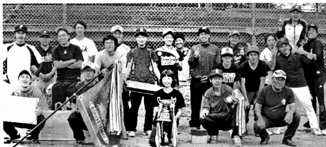
優勝 (株)ナカニシ Bチーム

雨天のため7日から14日に延期された組合親善ソフトボール大会が晴天に恵まれて、御殿山公園野球場で開催されました。盛大な応援を受けながら、8チームが熱戦を繰り広げ、(株)ナカニシが3年ぶりに優勝を果たしました。