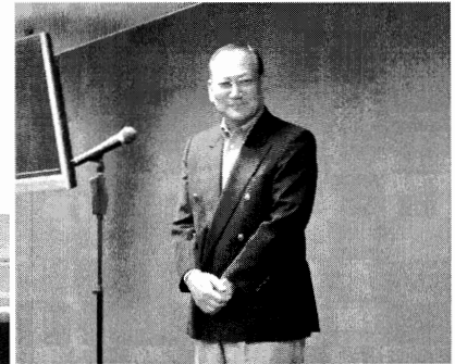
受入れ企業代表あいさつ