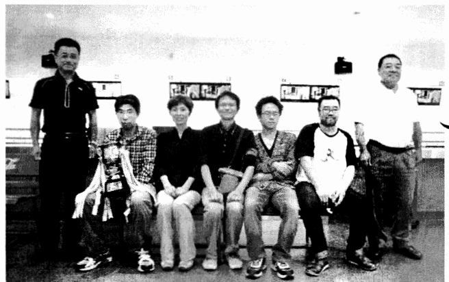
優勝～5位入賞の皆さん