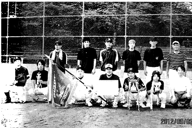
準優勝 (株)ナカニシ Bチーム